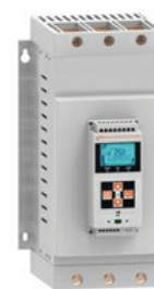
Softstart ADXL Asynchroniczny trójfazowy